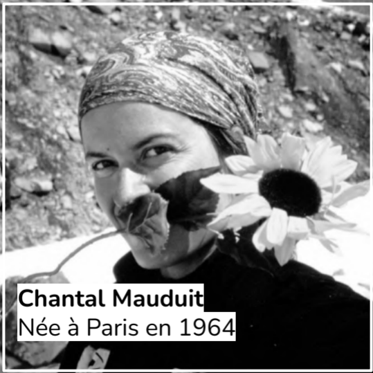
Chantal Mauduit Née à Paris en 1964