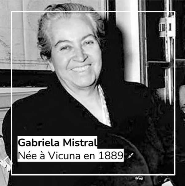
Gabriela Mistral Née à Vicuna en 1889