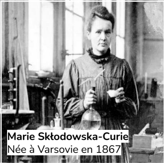
Marie Skłodowska-Curie Née à Varsovie en 1867